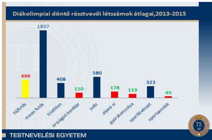
1. ábra: Az oszlopok felett az indulói létszámok átlaga látható az elmúlt 3 év országos diákolimpiai döntőjéről.

Statistikai próbák bizonyították, hogy szignifikáns különbség mutatkozik a tájfutás javára az országúti kerékpárral, alpesi sível, gyors korcsolyával és a sport aerobikkal szemben. Kiemelkedik a sorból a mezei futás (valószínűleg azért, mert ezen minden sportág képviselteti magát).